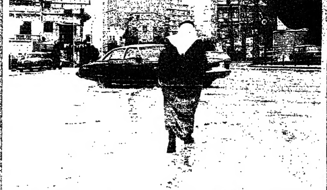
شارع حرمان مكنو بالطلوع

التلج وصل إلى بيروت أمس وأزال آثار الحرب من الشوارع بعدما كسى الجبال والقمل طريق شهر البيدر. والمنسفة الثلجية كما نوحصت حوالى الرصد الجوي. ستتم اليوم أيضا، ولكن بيروت التي عاشت لفترة وجيزة أجواء صيفية، قد لا تسع لها الفرصة لتبسة لتلج بركات الثلج.